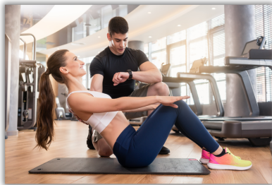
Sportler / Trainer